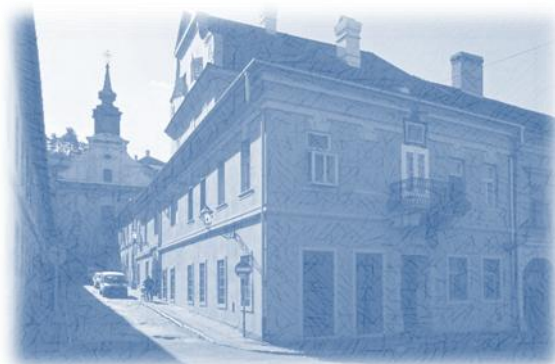
Rodna kuća Josipa bana Jelačića u Petrovaradinu

Kuća Josipa bana Jelačića u vlasništvu je Hrvatskog nacionalnog vijeća samo djelomice zbog poteškoća nastalih prilikom njenog otkupa, a čije rješavanje je u tijeku.