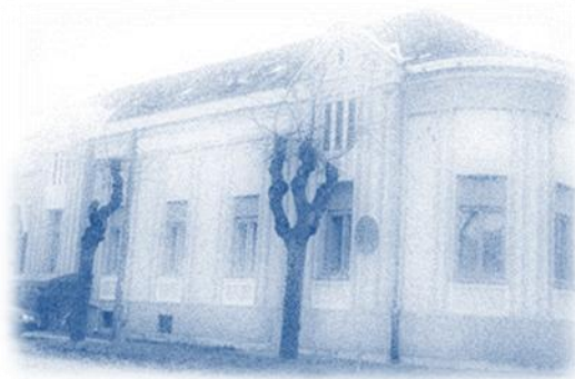
Zgrada Hrvatskog nacionalnog vijeća i Zavoda za kulturu vojvođanskih Hrvata

Sjedište HNV-a i njegova ureda je u Subotici, Preradovićeva br. 13.