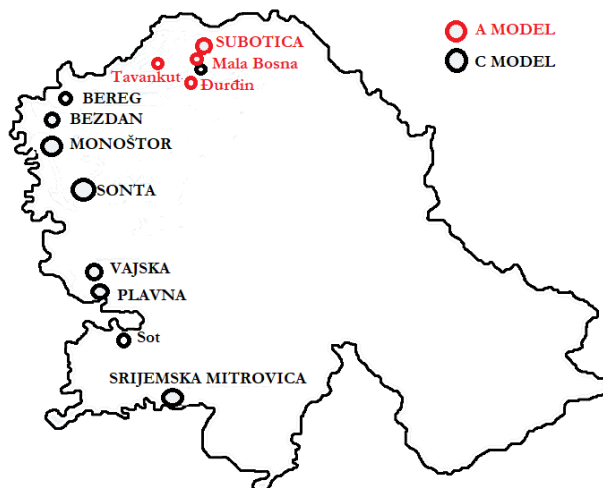
Rasprostranjenost obrazovanja na hrvatskom jeziku u Vojvodini prema modelima

Prema modelu A školske 2018./19. godine od vrtića do četvrtog razreda srednje škole nastavu pohađa 538-ero djece i učenika. Prema modelu C nastavu pohađa 470 učenika.